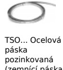
TSO... Ocelová páska pozinkovaná (zemní páska)