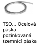
TSO... Ocelová páska pozinkovaná (zemnicí páska)