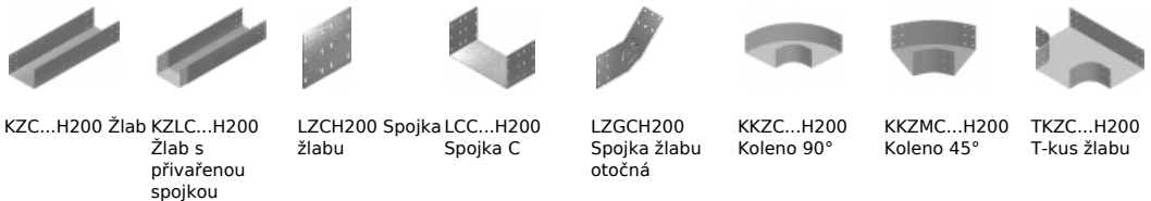
KZC...H200 Žlab KZLC...H200 Žlab s přivařenou spojkou LZCH200 Spojka žlabu LCC...H200 Spojka C LZGCH200 Spojka žlabu otočná KKZC...H200 Koleno 90° KKZMC...H200 Koleno 45° TKZC...H200 T-kus žlabu