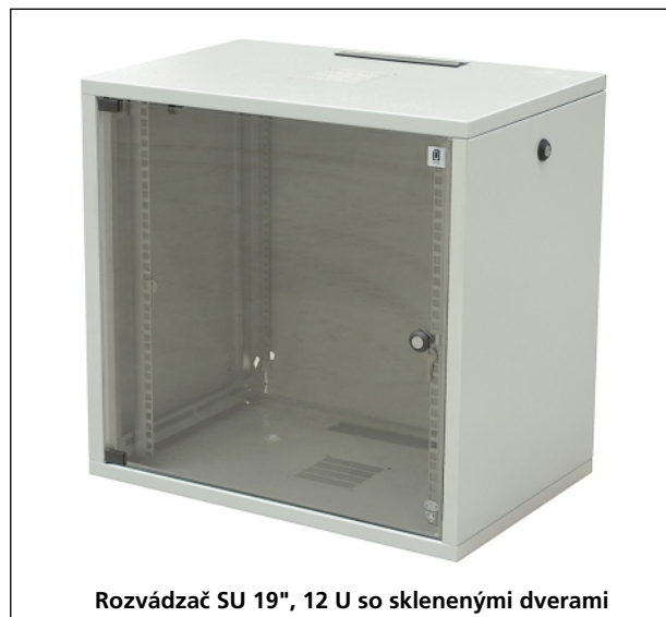
Rozvádzač SU 19", 12 U so sklenenými dverami