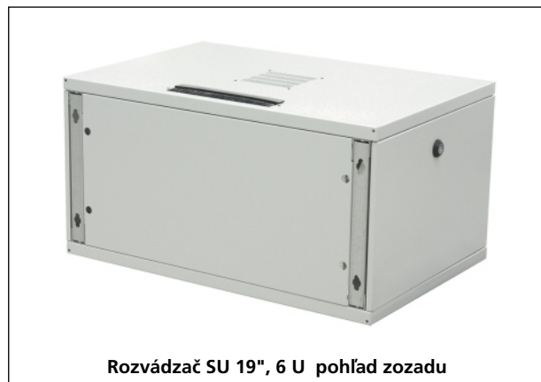
Rozvádzač SU 19", 6 U pohľad zozadu