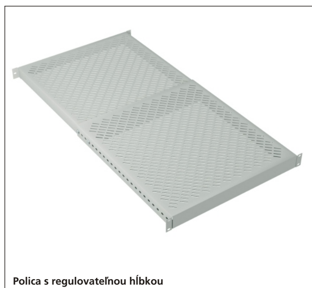
Polica s regulovateľnou hĺbkou