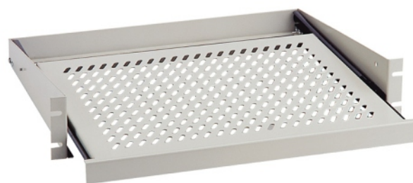
Polica II - vysúvateľná (19" x 2 U)