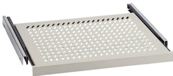
Polica I - vysúvateľná