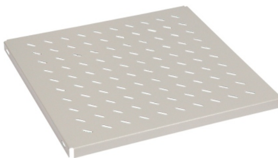
Polica I - pevná