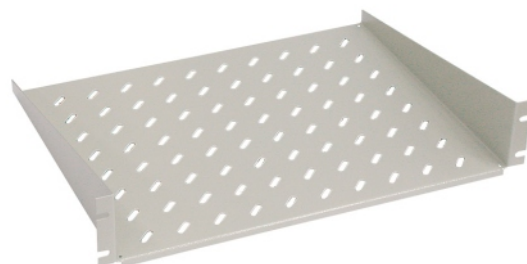
Polica II - pevná (19" x 2 U)