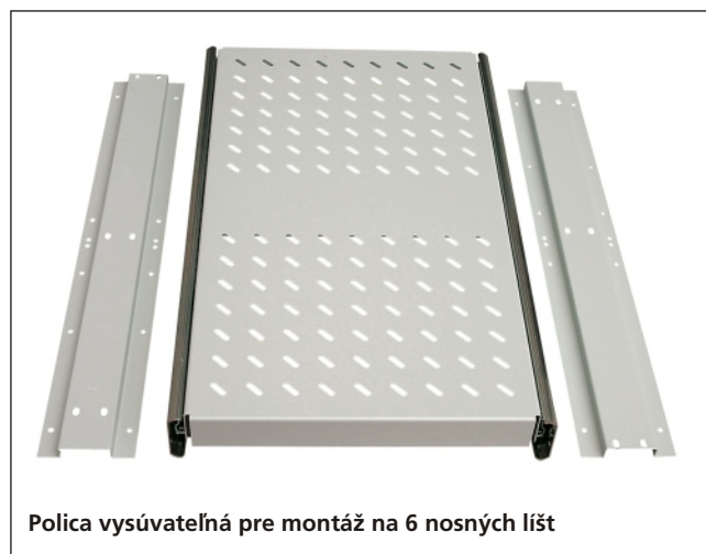
Polica vysúvateľná pre montáž na 6 nosných lišt