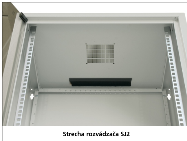
Strecha rozvádzača SJ2