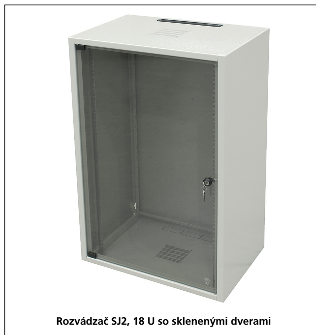
Rozvádzač SJ2, 18 U so sklenenými dverami