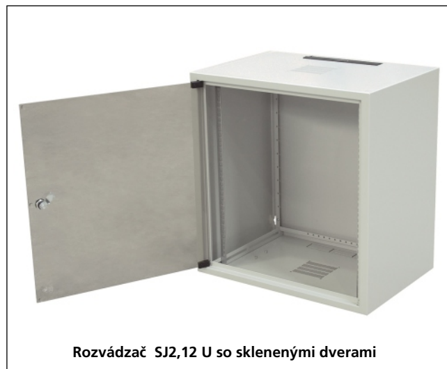
Rozvádzač SJ2,12 U so sklenenými dverami