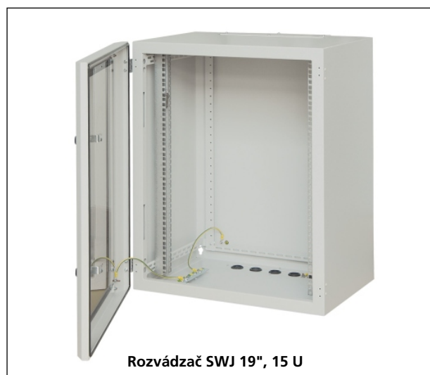
Rozvádzač SWJ 19", 15 U