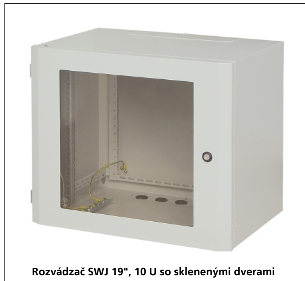
Rozvádzač SWJ 19", 10 U so sklenenými dverami