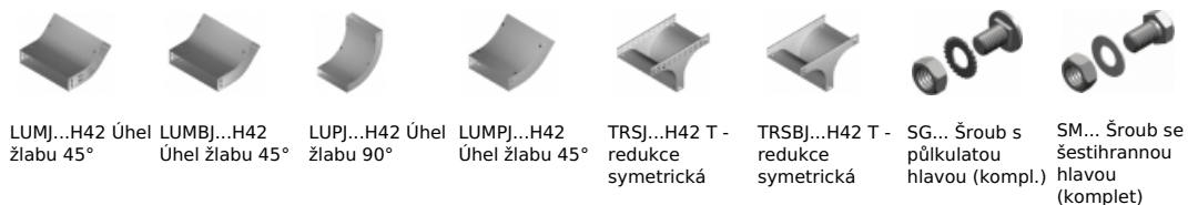
LUMJ...H42 Úhel žlabu 45° LUMB...H42 Úhel žlabu 45° LUPJ...H42 Úhel žlabu 90° LUMPJ...H42 Úhel žlabu 45° TRSJ...H42 T-redukce symetrická TRSB...H42 T-redukce symetrická SG... Šroub s půlkulatou hlavou (kompl.) SM... Šroub se šestihrannou hlavou (komplet)