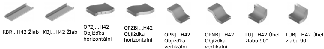
KBR...H42 Žlab KBJ...H42 Žlab OPZJ...H42 Objížďka horizontální OPZBJ...H42 Objížďka horizontální OPNJ...H42 Objížďka vertikální OPNB...H42 Objížďka vertikální LUJ...H42 Úhel žlabu 90° LUBJ...H42 Úhel žlabu 90°