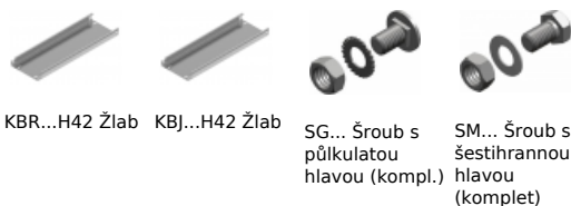
KBR...H42 Žlab KBJ...H42 Žlab SG... Šroub s půlkulatou hlavou (kompl.) SM... Šroub se šestihrannou hlavou (komplet)