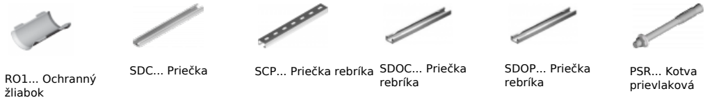
RO1... Ochranný žliabok