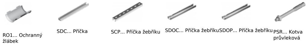
RO1... Ochranný žlábk