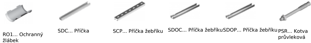
RO1... Ochranný žlábek