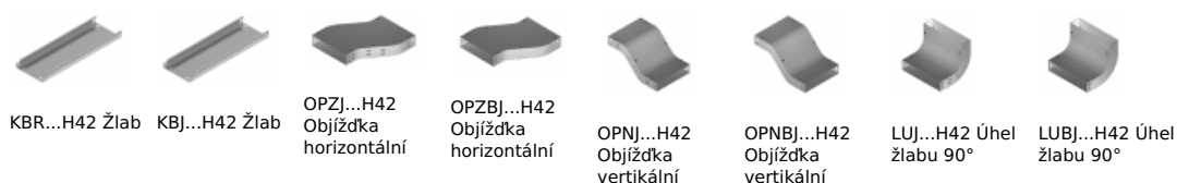
KBR...H42 Žlab KBJ...H42 Žlab OPZJ...H42 Objížďka horizontální OPZBJ...H42 Objížďka horizontální OPNJ...H42 Objížďka vertikální OPNB...H42 Objížďka vertikální LUJ...H42 Úhel žlabu 90° LUBJ...H42 Úhel žlabu 90°