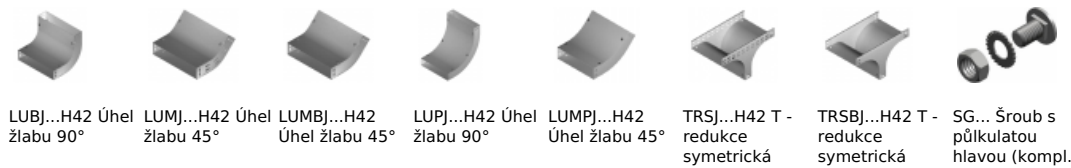
LUBJ...H42 Úhel žlabu 90° LUMJ...H42 Úhel žlabu 45° LUMBj...H42 Úhel žlabu 45° LUPJ...H42 Úhel žlabu 90° LUMPj...H42 Úhel žlabu 45° TRSJ...H42 T - redukce symetrická TRSBj...H42 T - redukce symetrická SG... Šroub s půlkulatou hlavou (kompl.)