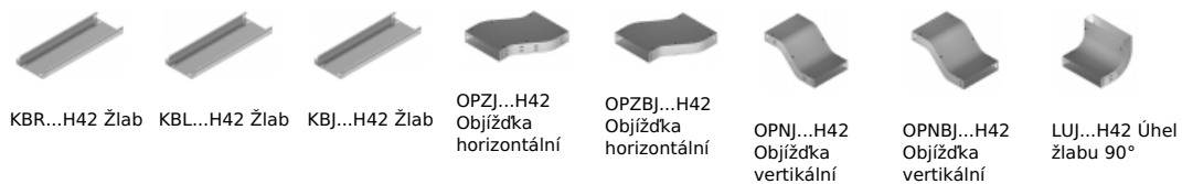
KBR...H42 Žlab KBL...H42 Žlab KBJ...H42 Žlab OPZJ...H42 Objíždka horizontální OPZBJ...H42 Objíždka horizontální OPNJ...H42 Objíždka vertikální OPNBJ...H42 Objíždka vertikální LUJ...H42 Úhel žlabu 90°