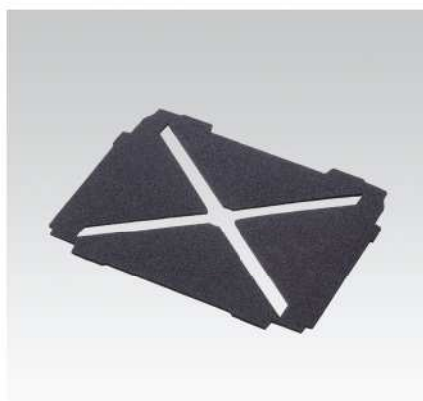
Polstrování dna s křížovým výřezem pro S1 a S3