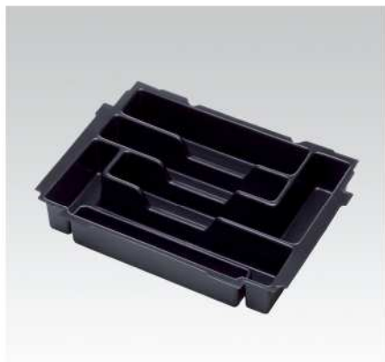
Vložka pro nástroje pro S1 a S3 – možno osadit mnoha způsoby