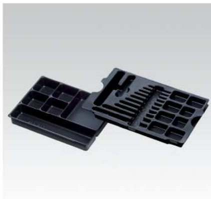
2-vrstvý hlubokotažený díl na bity, vrtáky a listy do přímočaré pilky pro M a M2 – pro přehledné ukládání