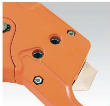
2 šrouby k výměně čepelí