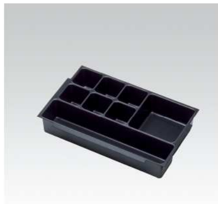
Univerzální vložka 8 přihrádek pro M1 a M2 – na drobné díly a nejrůznější nástroje