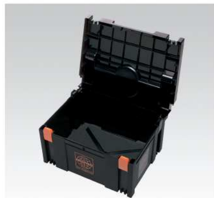
Plastový kufr S3 (s vyměkčeným dnem)