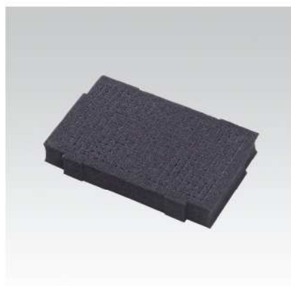
Prostorová vložka tvrdá pro M1 a M2 – k vyříznutí a vytvoření individuálních vložek, mnohostranné možnosti přizpůsobení