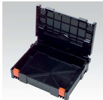
Plastový kufr S1