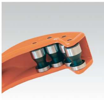
Vodicí kladky s drážkou