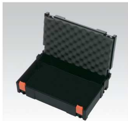
Plastový kufřík M2 (Obrázek ukazuje plastový kufřík M2 s vyměkčeným víkem jako příslušenstvím)