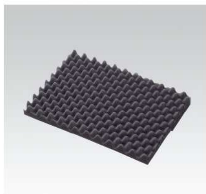
Polstrování víka s nopy pro S1 a S3 – maximální vyložení vnitřku