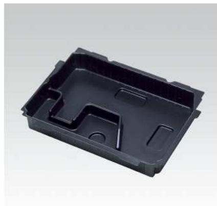
Vložka pro vrtací kladivo pro S1 – odpovídá CompactHammer MBK 600