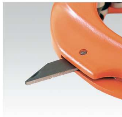
Integrované zajištění otřepů MRS 1