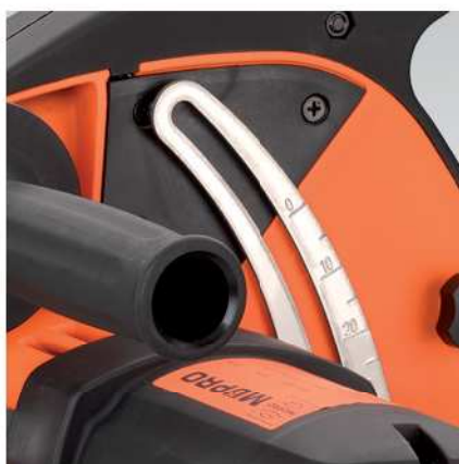
Stupnice pro nastavení hloubky řezu