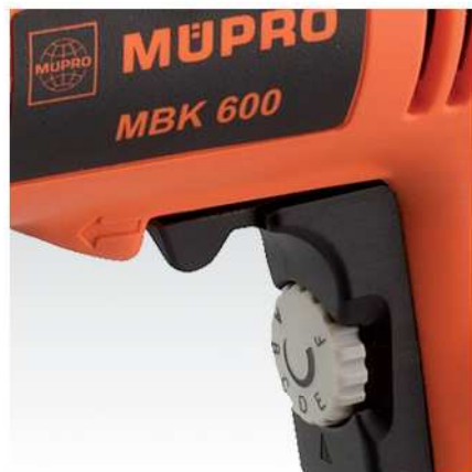
6-stupňová volba otáček přepínačem