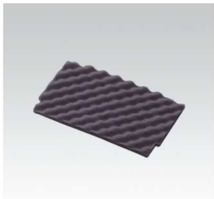
Polstrovaní víka s nopky pro M1 a M2 – maximální vyložení vnitřku