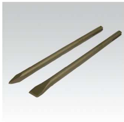
Špičatý a plochý sekáč