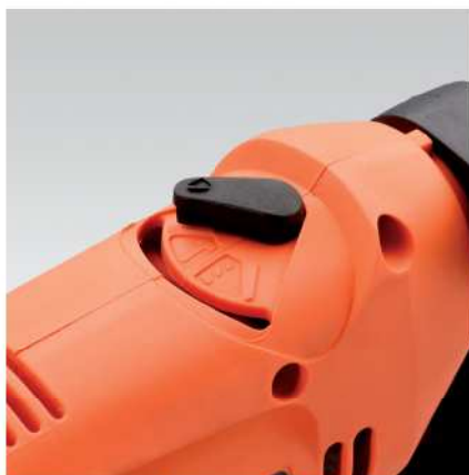
Přepínač příklepového a běžného vrtání