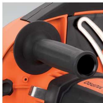
Ergonomická rukojeť pro přesné vedení během řezu