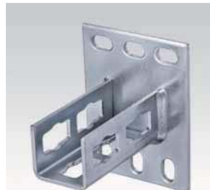
MPR-sedlová příruba typ S pro nosníky 41/41