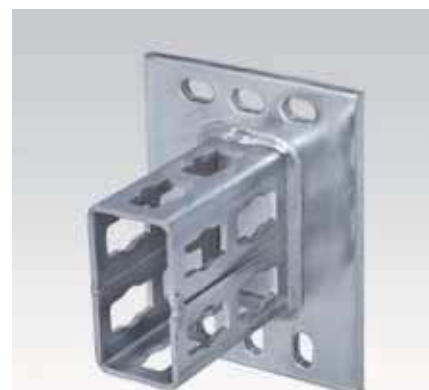
MPR-sedlová příruba typ S pro nosníky 41/82 a 41/124