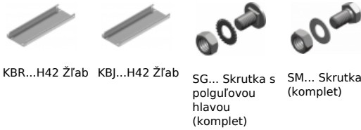
KBR...H42 Žľab KBJ...H42 Žľab SG... Skrutka s polguľovou hlavou (komplet) SM... Skrutka (komplet)