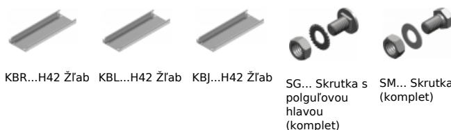
KBR...H42 Žľab KBL...H42 Žľab KBJ...H42 Žľab SG... Skrutka s polguľovou hlavou (komplet) SM... Skrutka (komplet)