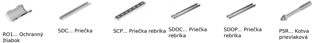
RO1... Ochranný žliabok